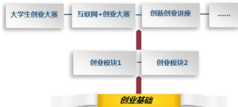
创新创业课程体系建设思路

创新创业教育实践课程模块的培养目标是了解创业的流程、企业的运营模式和项目运作等，掌握创业的基本技能，培养学生分析问题和解决问题的能力，提升学生的个人综合能力。可通过鼓励和组织学生参加企业经营管理类培训、大学生创业大赛、互联网+大赛、大学生创新创业项目等培训或比赛，邀请企业、行业专家开展专题训练，指导学生创新创业活动，促进创新创业的实践教学。其次，可以按照创业活动项目和特定的活动方式，开发创业沙盘、教学游戏和教学案例库，通过现实或模拟的创业实践活动，利用与专业相关的实践平台，利用虚拟的训练或虚拟创业公司，让学生身临其境地感触和体验创业的全部业务流程。创新创业实践课模块安排在第3-5学期，让学生在结合所学的专业基础上来领悟创新创业知识，提高创新创业能力。